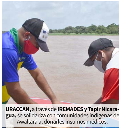
URACCAN, a través de IREMADES y Tapir Nicaragua, se solidariza con comunidades indígenas de Awaltara al donarles insumos médicos.

Sesión. Las coordinaciones de Tecnología Educativa de URACCAN se reúnen virtualmente para coordinar la implementación de la metodología virtual, correspondiente al segundo semestre académico 2020.