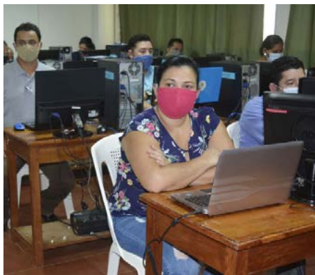
Campus Nueva Guinea capacita a su gremio docente en pedagogía virtual para garantizar la calidad educativa del segundo semestre.

Convivencia. Desde el área de Bienestar Estudiantil del recinto se estarán compartiendo vivencias culturales con estudiantado interno; tal actividad promueve el conocimiento y deguste de comidas típicas de los lugares de origen de los becados.