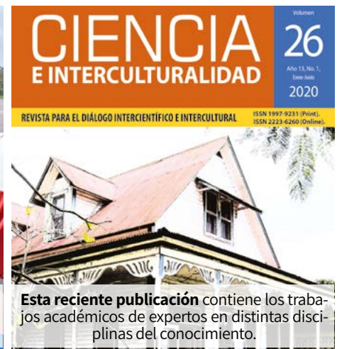
Esta reciente publicación contiene los trabajos académicos de expertos en distintas disciplinas del conocimiento.